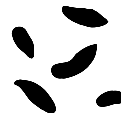
Afføring fra rotte